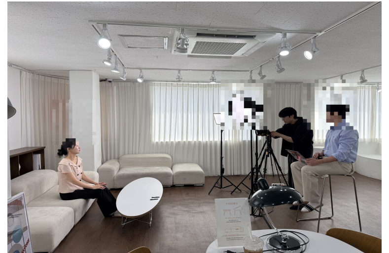
스튜디오 촬영 · 디렉팅