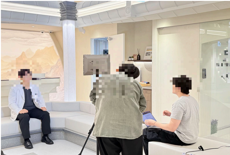
의원 인터뷰 촬영 현장

촬영팀을 따로 부르지 않습니다. 콘텐츠 기획부터 현장 촬영, 편집, 계정 운영까지 한 팀이 책임지기 때문에 메시지가 흐트러지지 않고, 처음 맡은 담당자가 끝까지 함께합니다.