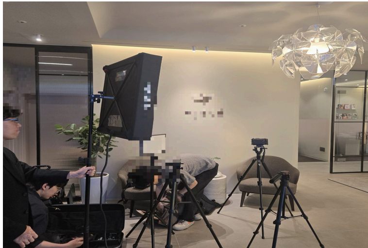
피부과 브랜드 영상 촬영